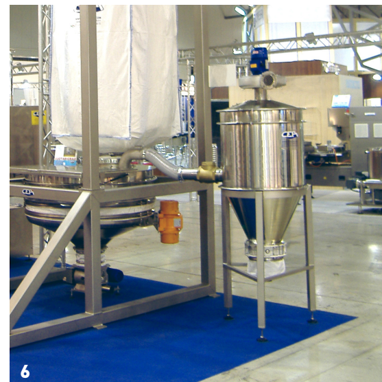
1 Sistema per riutilizzo sacconi 2 Estrazione con cono vibrante 3 Paranco per sollevamento sacconi 4 Vibrovaglio 5 Alimentazione multilinea 6 Aspirafumi